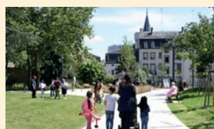
Promenade des 4 saisons