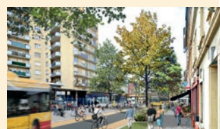
Développement des mobilités douces