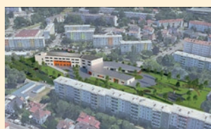
Futur groupe scolaire Victor Hugo