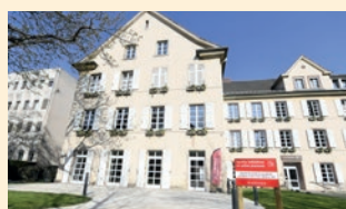
Nouveaux locaux du service Jeunesse