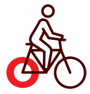
Rue des Bons Enfants