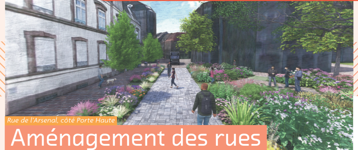
Rue de l'Arsenal, côté Porte Haute